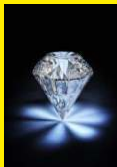
Premio femminile Diamante

SE ASSENTI POTRANNO RITIRARE IL PREMIO IL LUNEDÌ 10 OPPURE IL LUNEDÌ 17 OTTOBRE PRESSO LA SEDE DELLA PODISTICA PRATESE Piazza San Pietro,1 - SEANO (PO) dalle ore 21 alle ore 23. DOPO TALE DATA I PREMI NON VERRANNO PIU' CONSEGNATI.