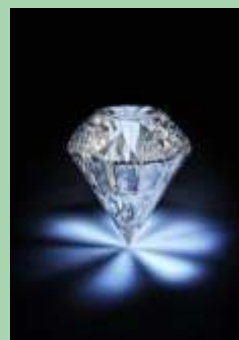
Premio femminile Diamante

SE ASSENTI POTRANNO RITIRARE IL PREMIO IL LUNEDÌ 10 OPPURE IL LUNEDÌ 17 OTTOBRE PRESSO LA SEDE DELLA PODISTICA PRATESE Piazza San Pietro,1 - SEANO (PO) dalle ore 21 alle ore 23. DOPO TALE DATA I PREMI NON VERRANNO PIU' CONSEGNATI.